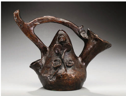
Рис. 3. Гоген П. Ваза с лицом женщины в цветах. 1887-1888. Неглазурованный грес. Национальный музей керамики, Севр.