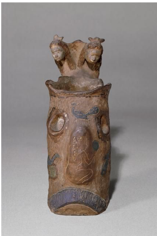
Рис. 2. Гоген П. Ваза в форме ствола дерева, украшенная двумя головами, фигурой женщины и птицами. 1887-1888. Неглазурованный грес. Музей Орсе, Париж.