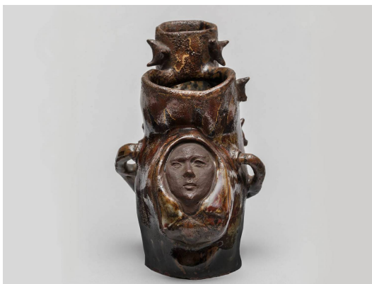
Рис. 1. Гоген П. Двойной сосуд с маской женщины. 1887-1888. Частично глазурованный грес. Новая глипготека Карлсберга, Копенгаген.