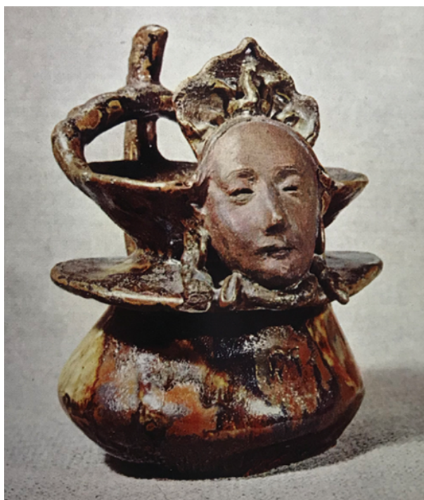
Рис. 4. Гоген П. Горшок, декорированный головой женщины в тиаре. 1887-1888. Частично глазурованный грес. Музей Пти Пале, Женева.