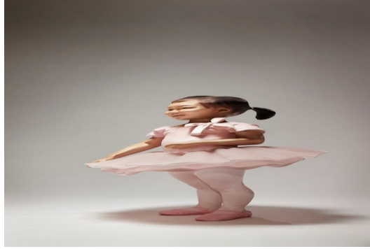
Рис. 1. Рисунок 1 – Скульптура девочки. Художник Ёи Хван Квона