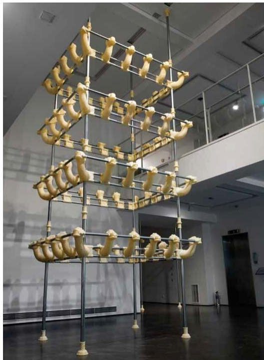
Рис. 3. Рисунок 3 – Элементы скульптуры Пэк Чжонги, напечатанные на 3D-принтере: головы драконов