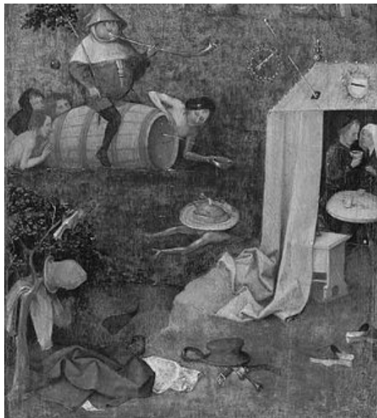
Рис. 2. Босх И. Аллегория чревоугодия и сладострастия: https://artgallery.yale.edu/collections/objects/43515