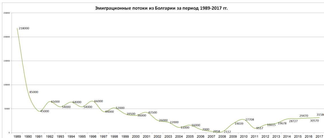
Рис. 1. Эмиграция из Болгарии за период 1989-2017 гг.