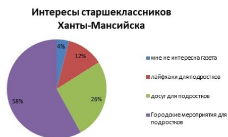
Рис. 2. Рисунок 2