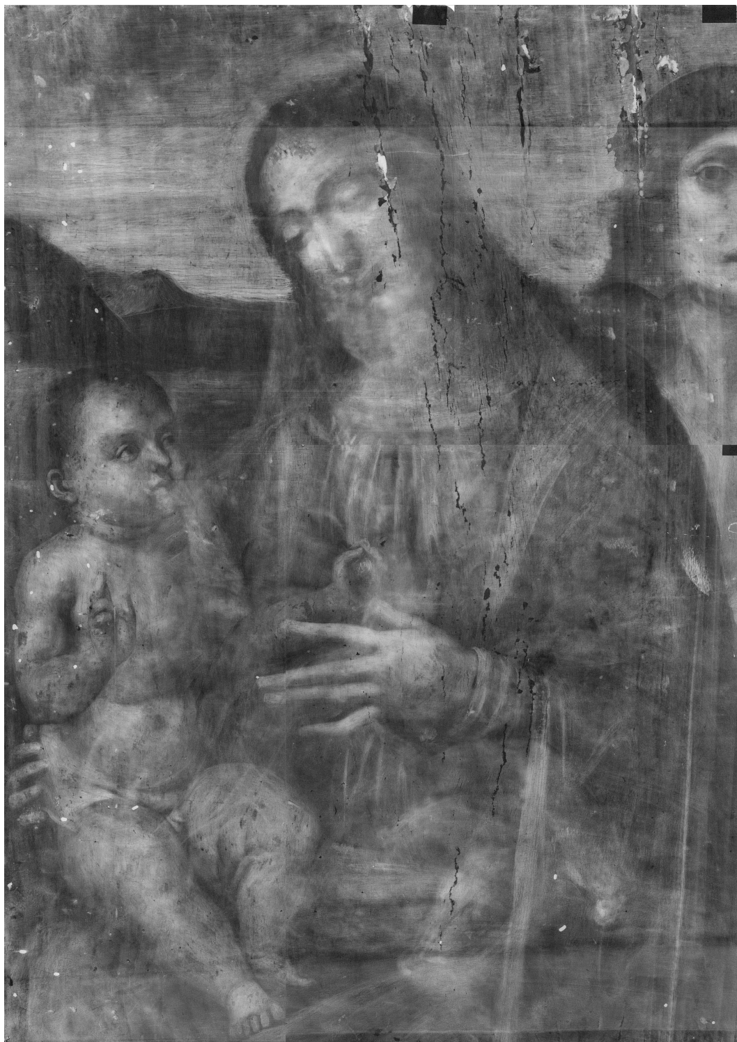
Рис. 1. Н.х. Мадонна. Италия. XVIвек. Дерево, масло, 68 х 47 см., Ж-58, КП-2249, ГБУК г. Москвы «Музей-усадьба «Останкино». Рентгенограмма.