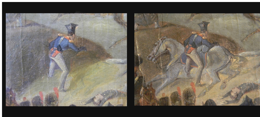
Рис. 2. А.Е. Коцебу. Сражение при Кульме (Богемия). Холст, масло, 71,0x98,5 см., инв. № III 5666, ГИМ. Вид фрагмента картины до и после удаления записи