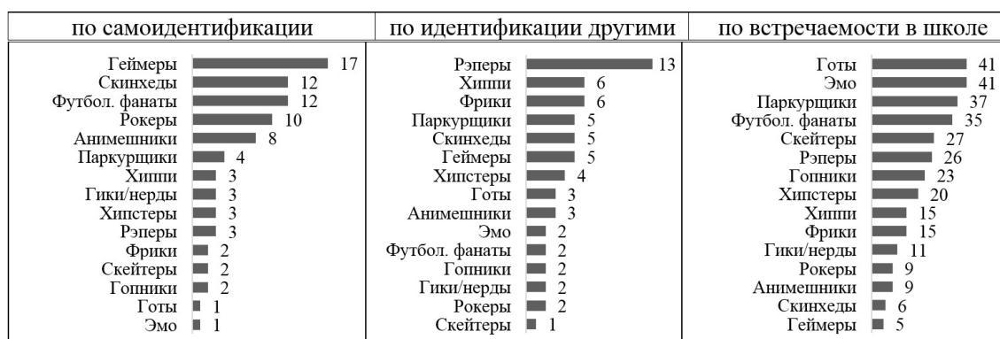
Рис. 1. Таблица 1. Распространенность молодежных субкультур, % (n 600)