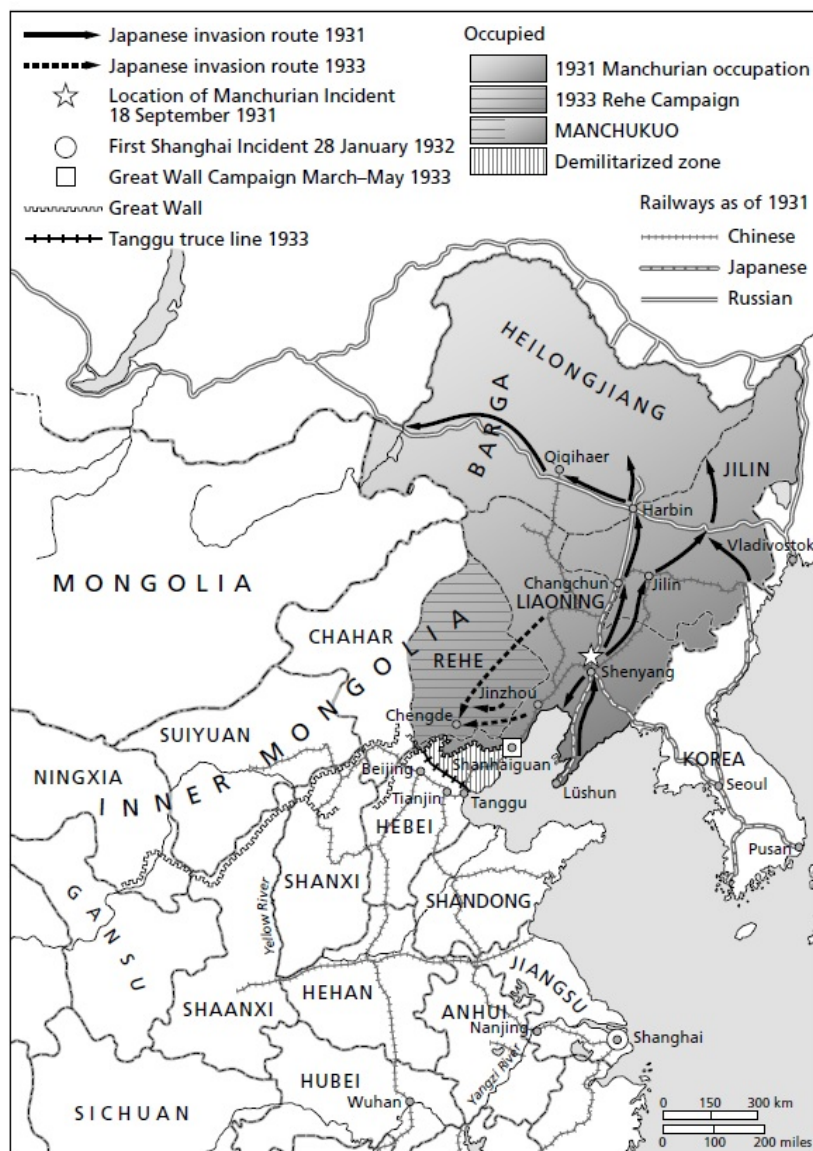
Рис. 1. По изданию S. C. M. Paine, The wars for Asia, 1911–1949, N.Y.: Cambridge University Press, 2012