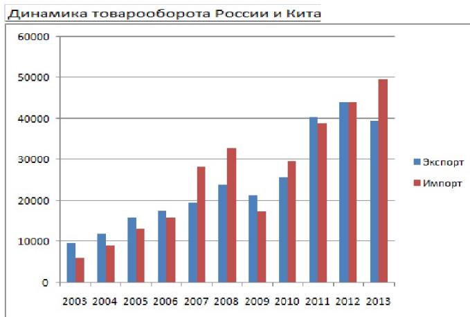
Рис. 3. Динамика товарооборота России и Китая 2003-2013 гг.