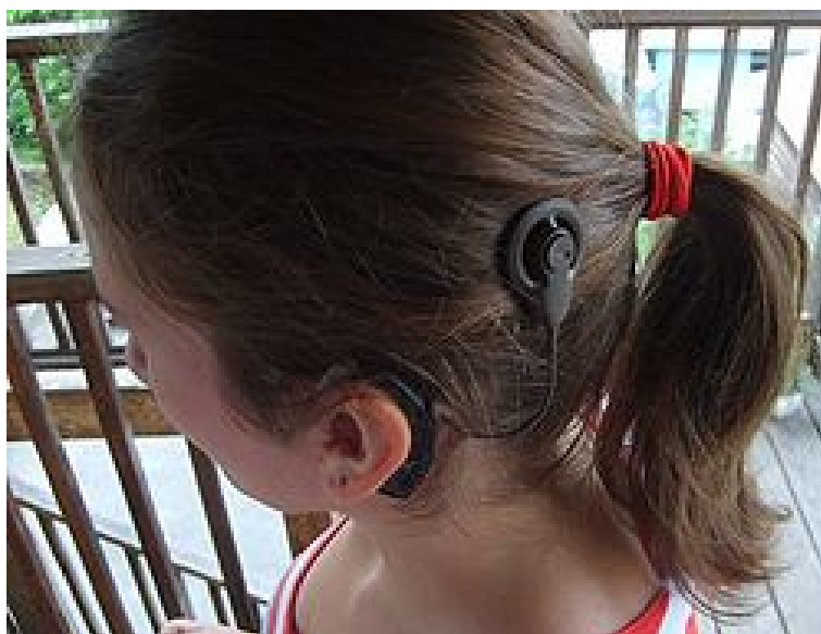
Рис. 4. кохлерные импланты