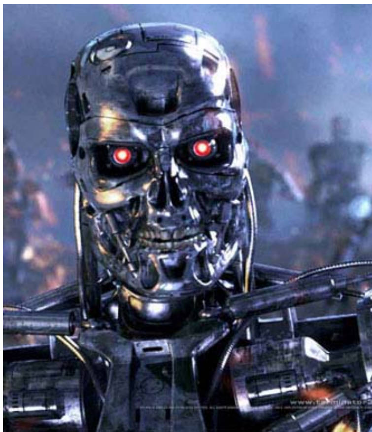
Рис. 5. люди-киборги