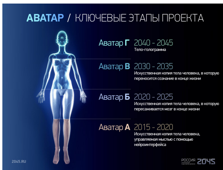
Рис. 2. ключевые этапы проекта