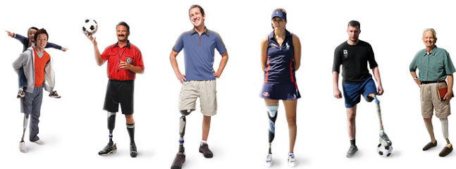
Рис. 3. достижения протезирования