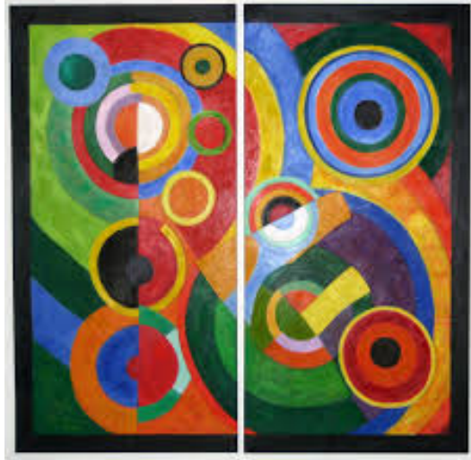
Рис. 1. Р.Делоне «Ритм», 1912