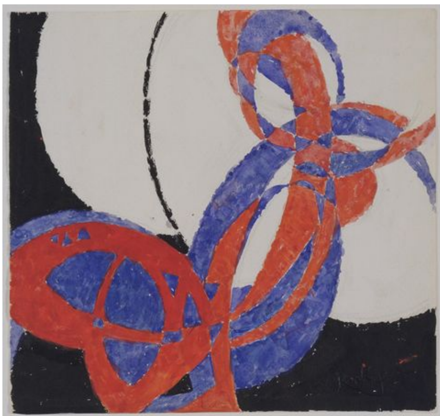
Рис. 2. Ф.Купка «Реплика Фуги в двух цветах: Амфора», 1912