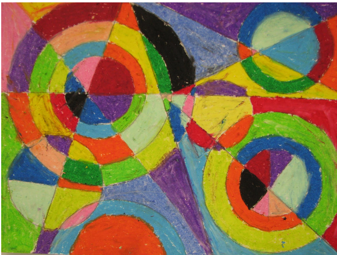
Рис. 4. Р.Делоне «Цветовой взрыв», без даты