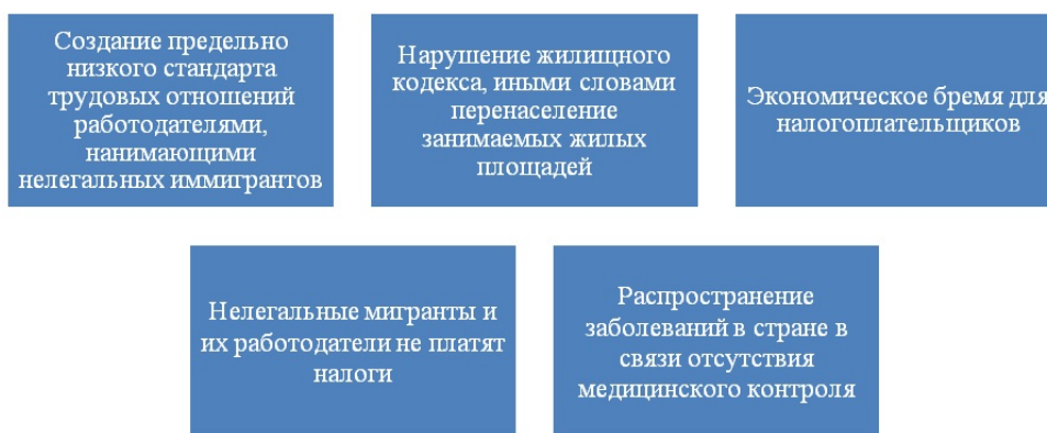
Рис. 2: Рисунок 2- Негативные последствия трудовой миграции