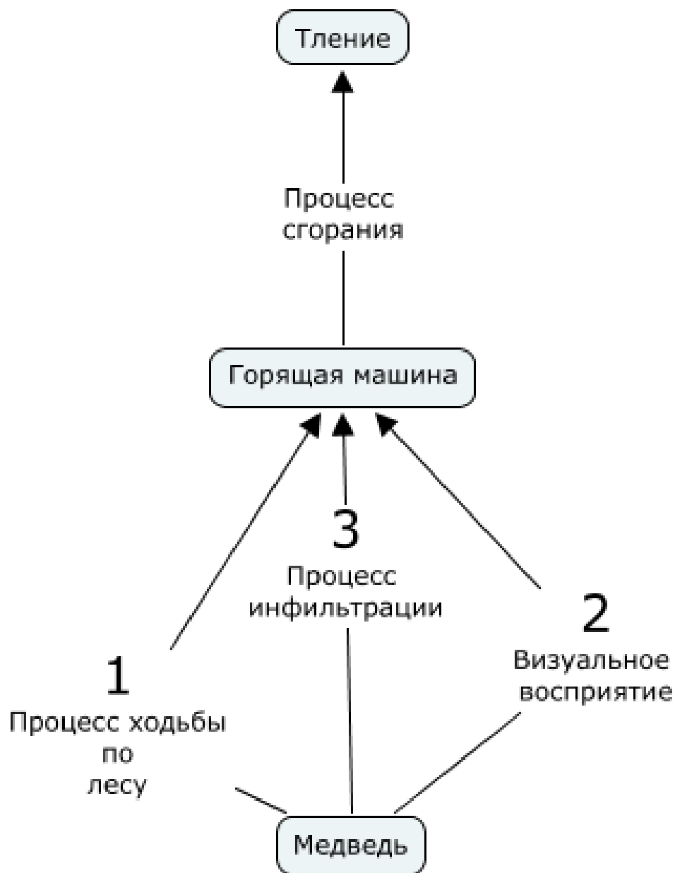
Рис. 4: Карты Понятий, составленные авторами научного проекта и использованные ими в педагогической практике