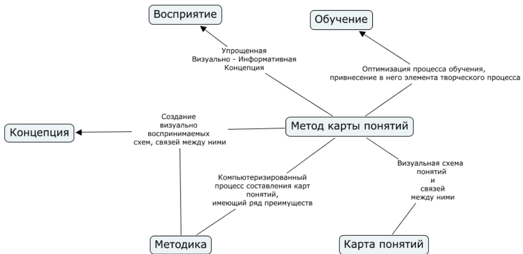
Рис. 3: Карты Понятий, составленные авторами научного проекта и использованные ими в педагогической практике