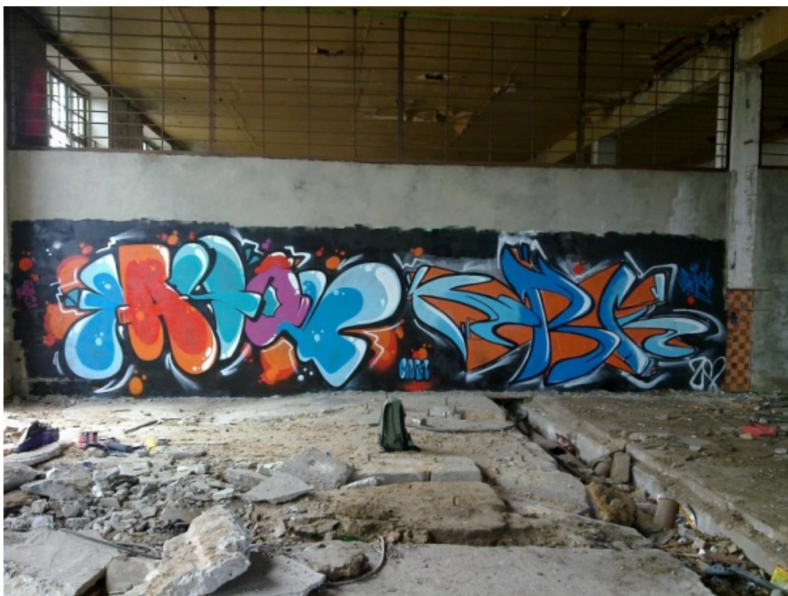
Рис. 4: СПАМ