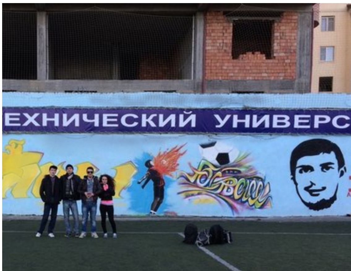
Рис. 6: Мы