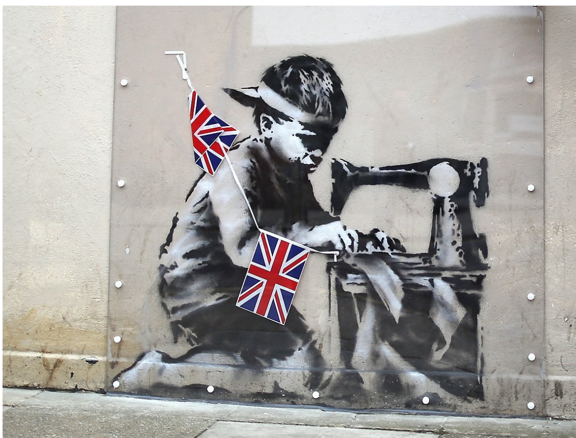
Рис. 1: Бэнкси