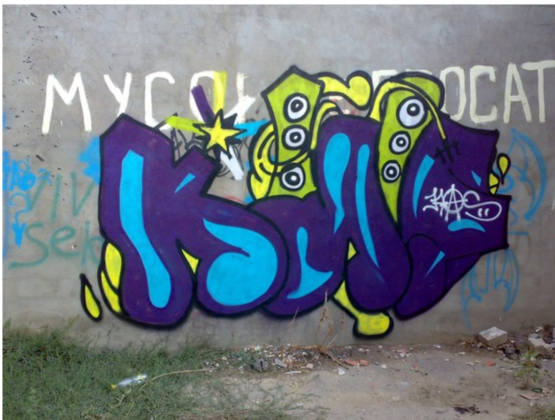
Рис. 5: Мугуддин-Кас