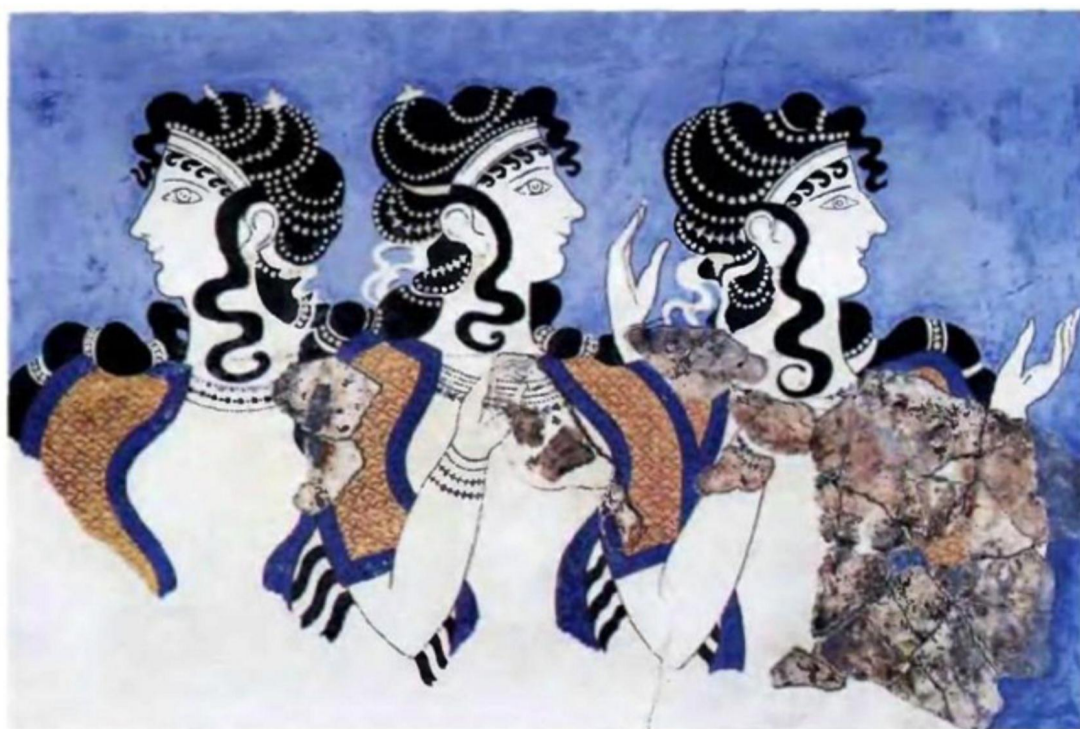
Дамы в голубом. Фреска Кносского дворца