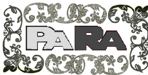
Рис. 2: Приложение 2