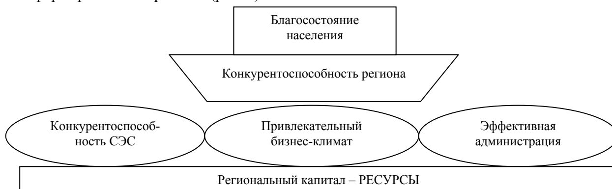
Рисунок 2. Стратегическая платформа региона

Приступая к разработке стратегии области необходимо ориентироваться на входящие в этот регион города и их особенности [3]. В то же время направления развития города, с учетом его особенностей, должны быть максимально близки к концептуальной стратегии области. В связи с этим мы предлагаем всесторонний подход к формированию стратегии (рис. 2).