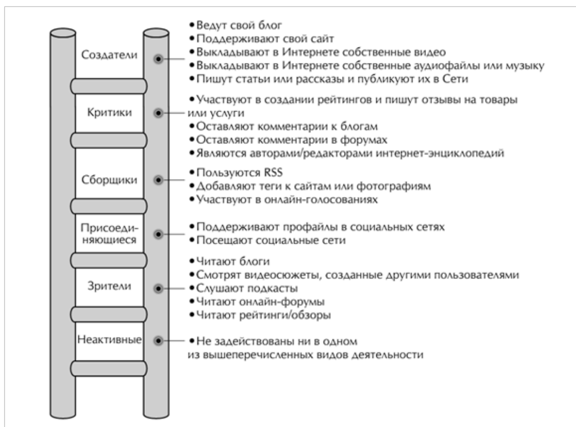
Рис. 2: Социальная технографическая лестница