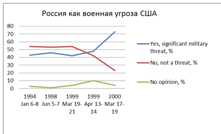
Рис. 3: Рисунок 3