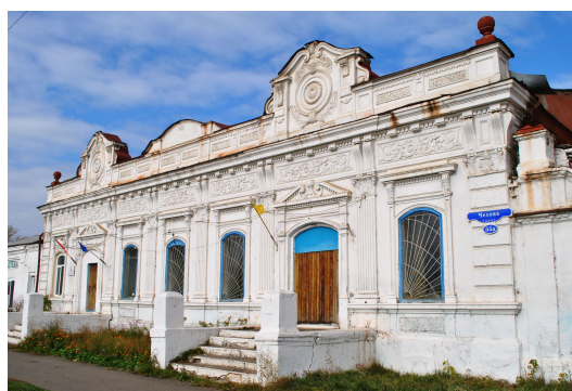
Рис. 4: Магазин купца Ф. С. Афонина в г. Тюкалинске. Фото 2010 г.