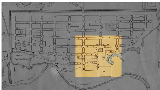
Рис. 1: План г. Ялуторовска (с выделенной центральной частью). 1858 г.