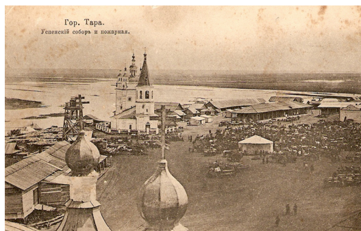
Рис. 3: Базарная площадь и Успенский собор в г.Тара. Открытка начала XX в.