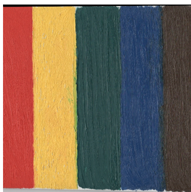
Рис. 2: Верхний слой картины