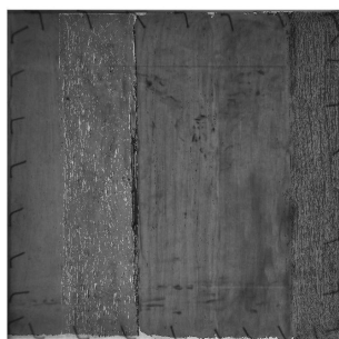
Рис. 3: Восстановленный внутренний слой