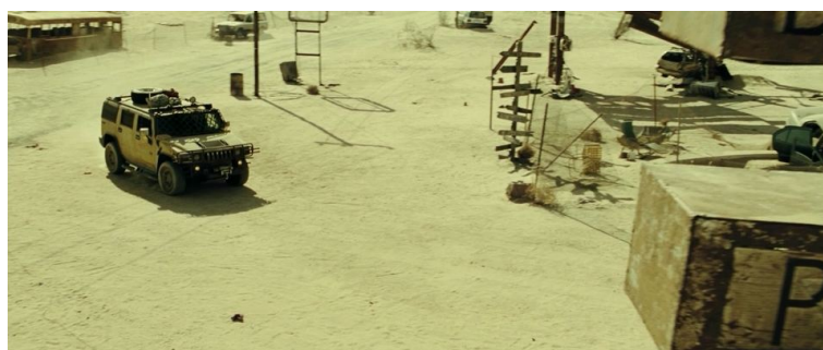
Рис. 1: исходный кадр